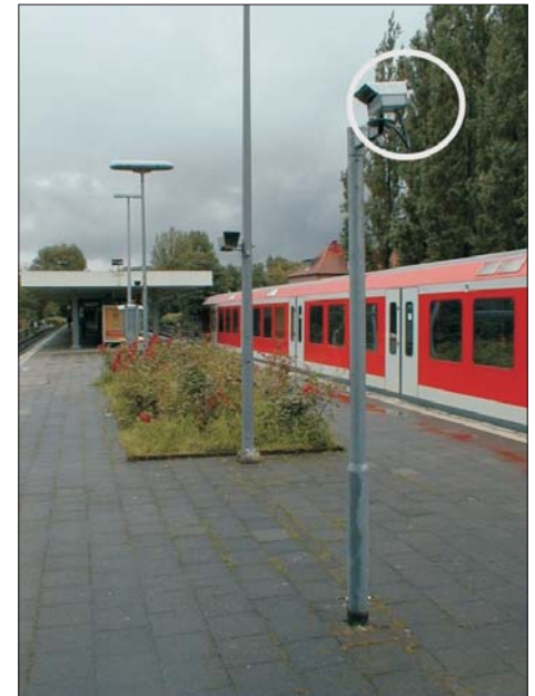
Infrarot - Präsenzdetektor FLG 10-20

Die Detektionsreichweite und Wirksamkeit der Hintergrundausbldung können vom Anwender in einem großen Bereich frei gewählt werden.