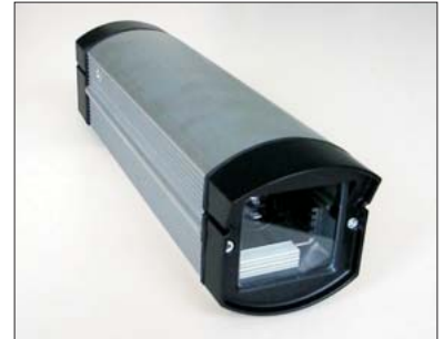
IVIS im IP 66 Gehäuse