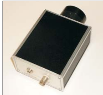
IVIS im IP 20 Gehäuse